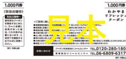
クーポン1,000円券（裏面）