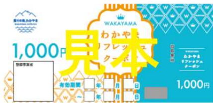
クーポン1,000円券（表面）